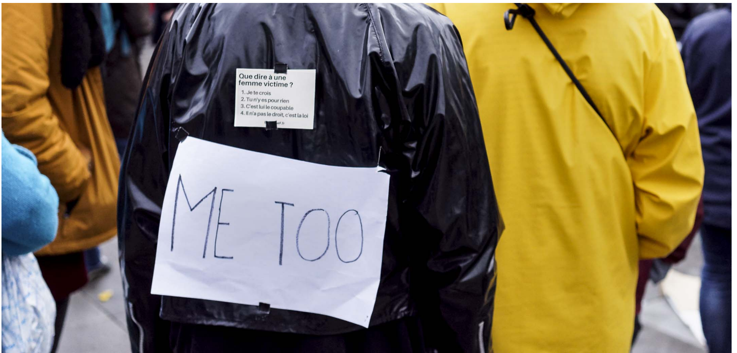
2017年10月29日，法國巴黎，一個反對暴力侵害婦女的集會，有出席者貼上「metoo」紙牌。

過往討論這類事件時，經常聽到有人說「現在的男生很可憐、被指控性騷擾人生就毀了」，以此隱隱反挫相關運動，但事實上，縱觀過去五年全球的#metoo運動，到底哪一次有毀掉一名男性的人生？放眼看去，只有遭到80名女性起訴的韋恩斯坦被判入獄23年，其餘大部分名人未必都有真心道歉過，還都在「作品和人品要區分看」的爭議區間繼續爭取名聲。討論取消文化過度的時候，有誰真的被取消了呢？