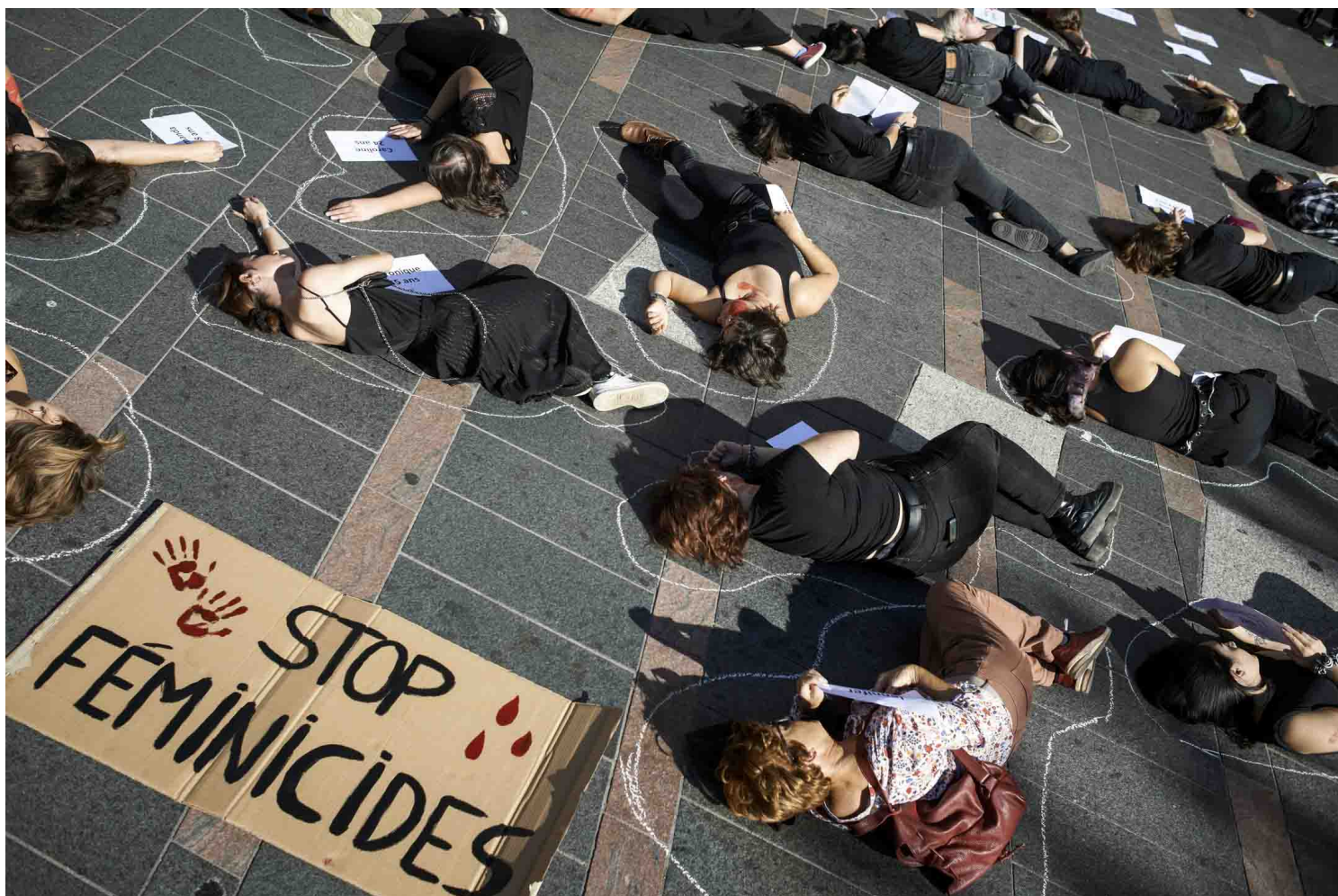
2022年10月22日，法國圖盧茲，女性團體請願呼籲停止女性暴力，現場有床單上寫著2022年遇害女性的姓名和年齡，而女示威者

一種常見的質疑是，是否要相信每一個控告者、只要是女性就要相信？過去五年眾多倡議者、行動者的思考是，#metoo 的重點應該是當事人之間的互相支援、共情，而不是任何一個人的任何一個說法。我們需先了解，#metoo 是一種「自證」，這點在不同的語境中有不同演繹：在女權受打壓、言論不自由的中國，這種自證成本更高；而在言論相對自由、雙方可攻防的如美國和台灣，如果在事實上有任何出入，取證是相對可做到的。