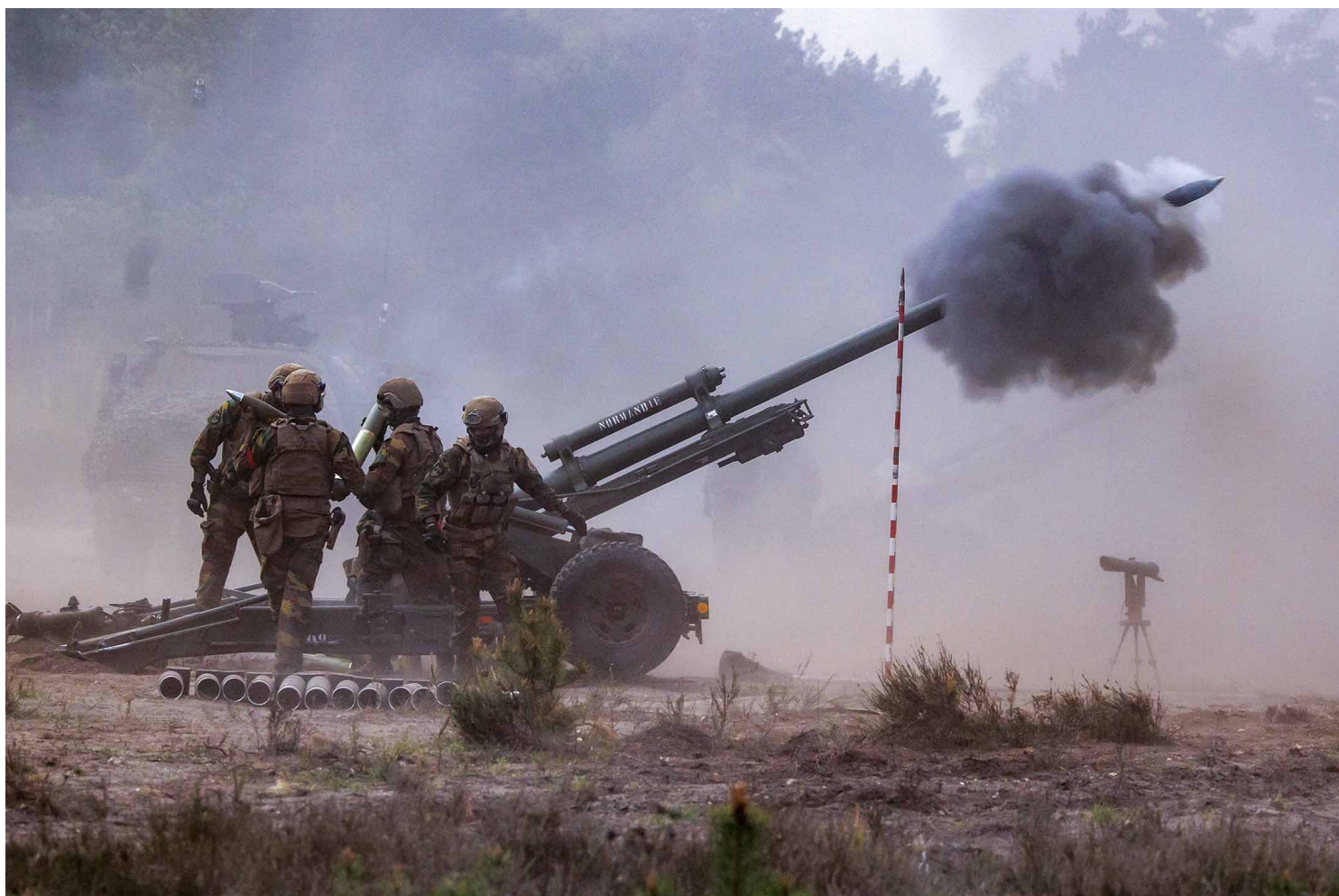
2022年5月10日，德國，北約反應部隊的國際聯合軍事演習。

而北約繼續東擴，進入印太地區的優點，在於北約國家長期進行聯合演習，從裝備補給到指揮通訊都已完成整合，可立即與美國協同作戰。其次是北約成員國多數是富裕國家，雖然承平時期的國防預算偏低，在優渥的社會福利下，艱難維持最低的軍備水準，但真正需要時，還是具備充沛的國力可以支援。以俄烏戰爭為例，烏克蘭能抵擋俄羅斯的入侵，北約在背後支援武器彈藥，是最關鍵的因素。而且英、法、德等國，在印太地區有許多經濟投資，法國更有殘留的殖民地，都是歐洲國家介入印太事務的動機。