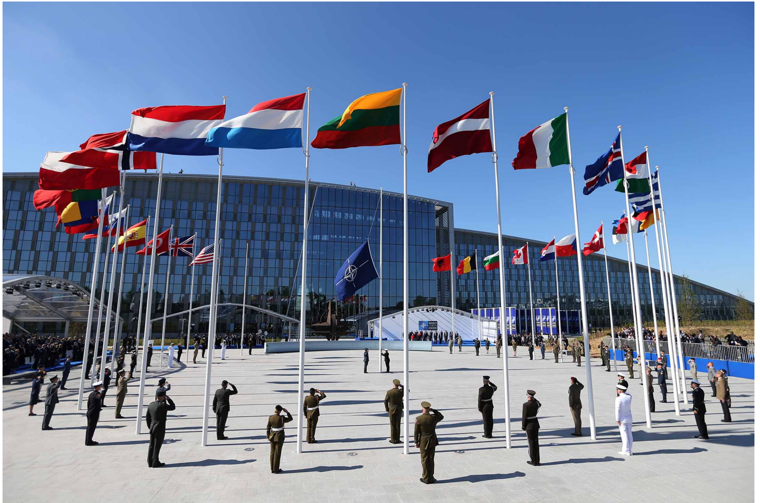
2017年5月25日，比利時布魯塞爾，北約成員國的旗幟在北約總部飄揚。