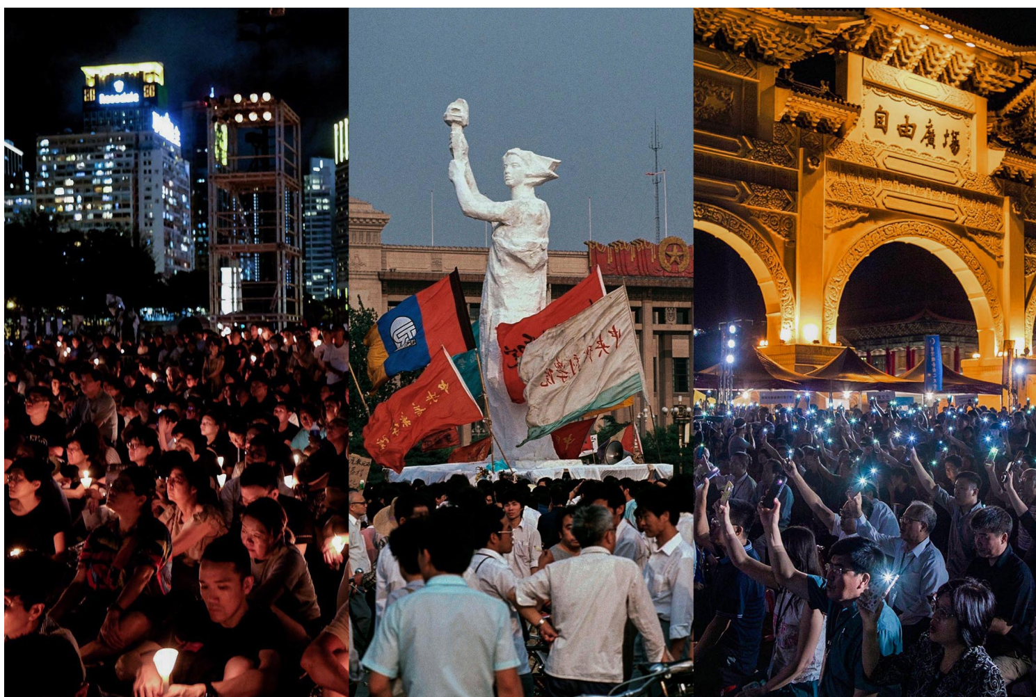
2018年6月4日，香港維多利亞公園；1989年6月1日，北京天安門廣場；2019年6月4日，台北中正紀念堂。