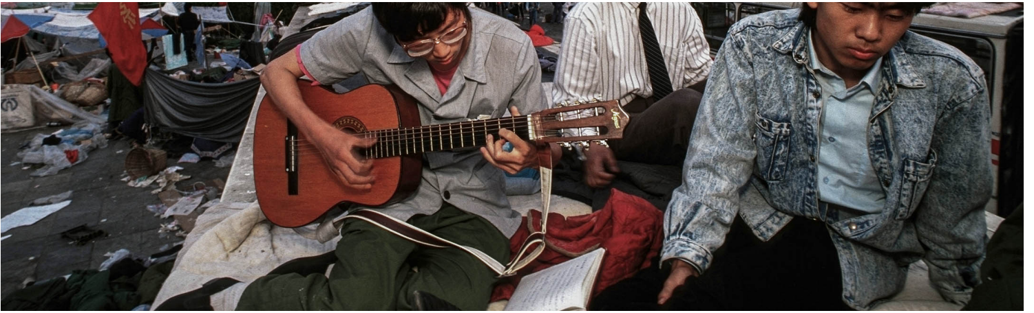
1989年6月1日，北京，一名男子在睡滿示威者的天安門廣場上彈吉他，以音樂和平抗議。

端：可能也跟政黨要回應的對象不一樣，他們要回應的是對手、民眾的想法；而在香港的政治論述中，不論大中華派還是本土派的立場，一直以來一個重要的「他者」是中國。我們先看看，六四給中國留下了什麼？政治學上關於九十年代中國社會保守化轉型，跟六四是怎樣的關係？對後來中國的社會運動，六四是怎樣的一種資源？