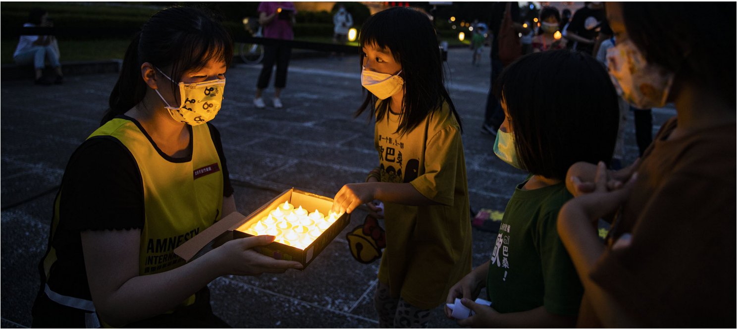
2022年6月4日，台北中正紀念堂，六四三十三週年悼念晚會。

端： 對台灣來說，六四對哪個世代最有感覺？九十年代前後，也是國民黨政權從戒嚴到解嚴、台灣醞釀和推動民主化的時代，發生在對岸的六四有什麼意義？