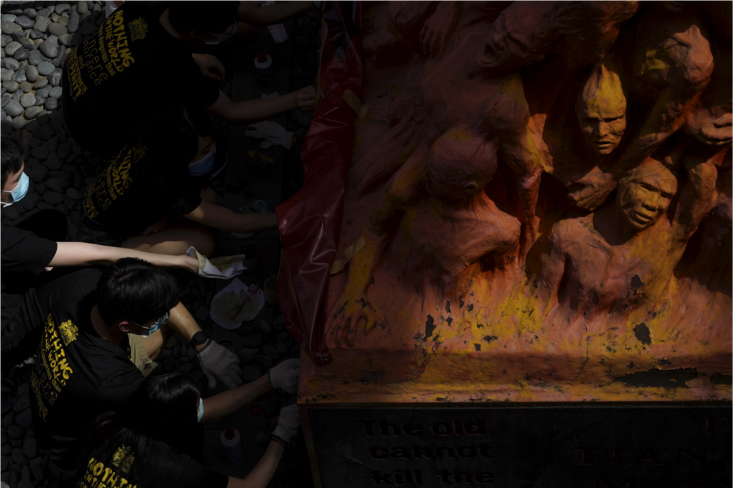
2020年6月4日，香港大學學生會洗刷國殤之柱。