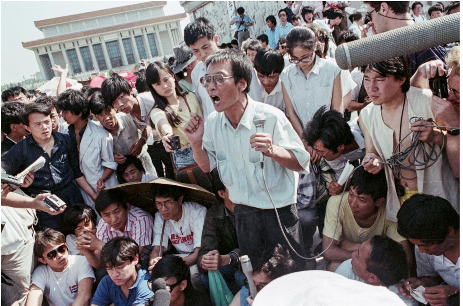
1989年，劉曉波向天安門廣場的人群發表講話。

另外，中國政府也在試圖重新定義「人權」的概念，區分政治和經濟權利，說中國優先人民的經濟權，「發展是最大的人權」。這個敘事在中國大陸逐漸變主流了，有時看社交媒體上關於六四的評論，中國海外留學生留言的，會比較莫名其妙，看到六四的反應是「大家要珍惜現在的幸福生活，幸福生活來之不易。」大家最大的經驗還是「不要亂，亂了就阻礙發展，要保持社會穩定。」