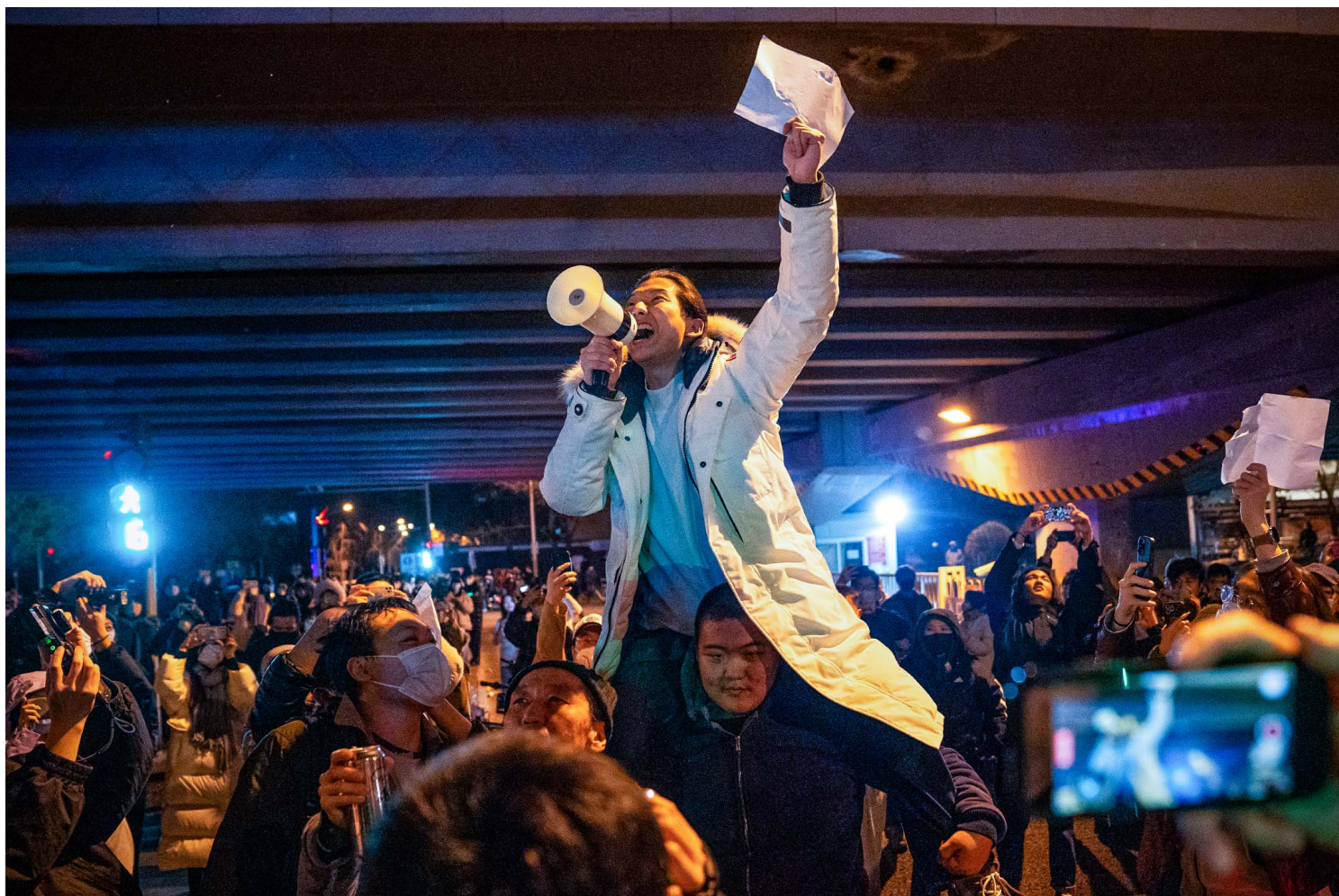
2022年11月28日，北京的示威活動中，一名示威者舉著白紙並高喊口號。在街頭和大學校園，反對封控的抗議蔓延中國各地。

說到外部經驗，對中國人而言，更重要的反而是蘇聯解體的映照。中國和西方的知識份子界都會有一個對比，就是激進和漸進改革的比較，比如蘇聯解體後俄羅斯採用了所謂的陣痛療法，效果很差，中國搞改革開放，漸進的效果似乎很好。這個對比進一步減弱了民主化在中國的可信力。九十年代以後，中國的主流都是體制內改變，不挑戰體制地進行小修小補，中國的很多自由派也比較接受這個話語。民主化的吸引力就相當小了。