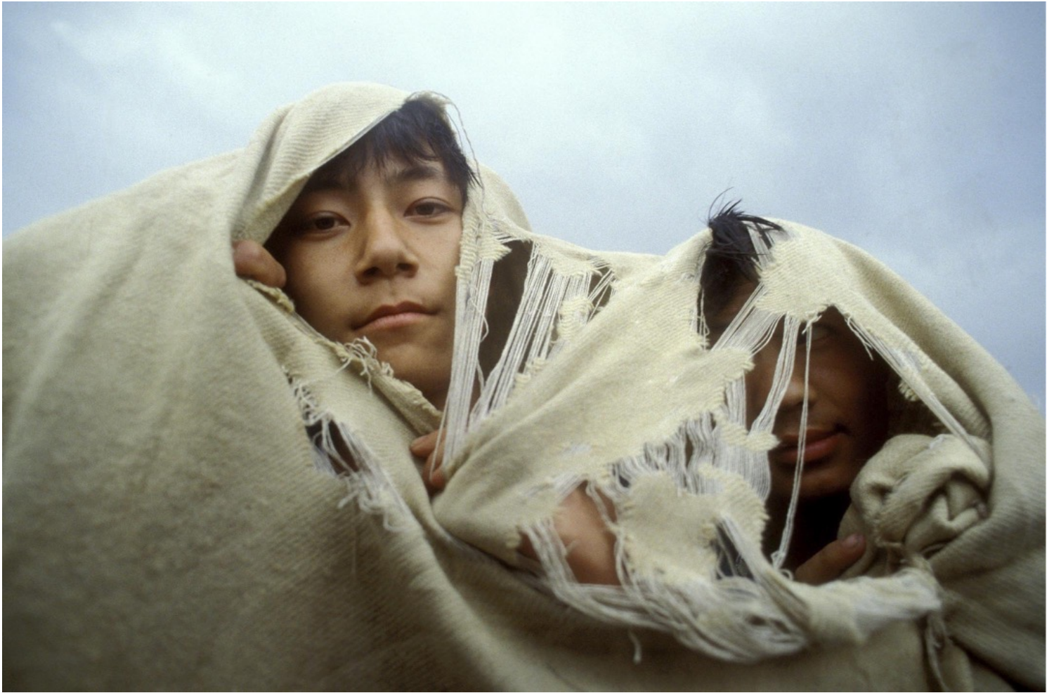
1989年5月25日，北京，兩名在天安門廣場參與民運的學生。

中國政治在中短期也許沒甚麼改變空間，但終究沒有任何人和組織，可以長久地主導歷史發展。對於香港而言，當中的民主化挑戰在守不在攻，關鍵是守時待變，這也許是一個大家「鬥長命」的遊戲。