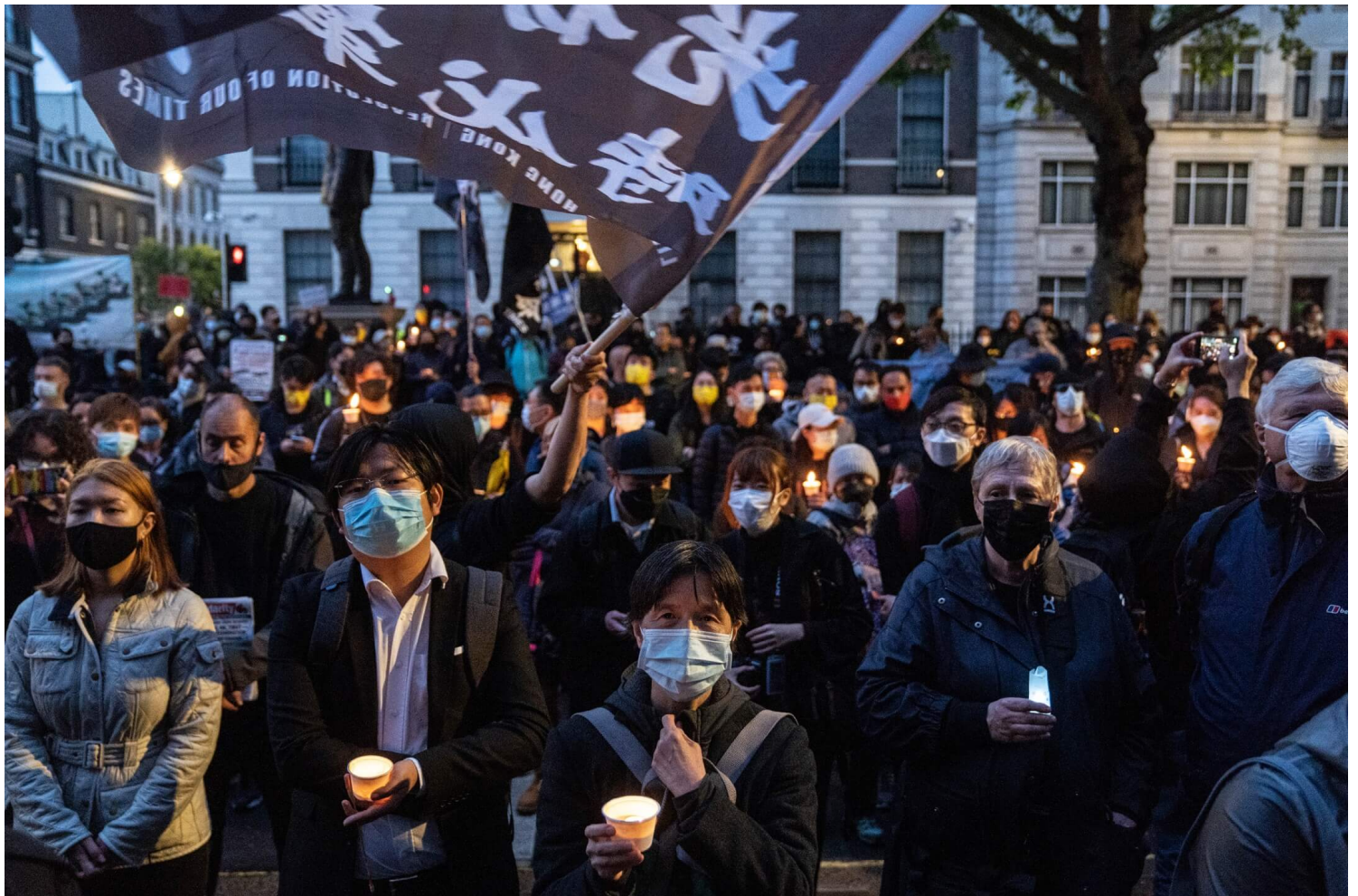
2021年6月4日，英國倫敦，市民在當地中國領事館外聚集，悼念六四32週年。

另一方面就是網絡上的東西。現在也困難的，但6月4日換社交平台的profile picture、在Instagram上載相片，你仍然預期會存在。然後你在facebook，網絡會看見海外的事情。這是一個頗奇特的狀態，因為有些東西你是不能share的，看完不一定覺得有空間去分享、發表感想，但起碼看見。