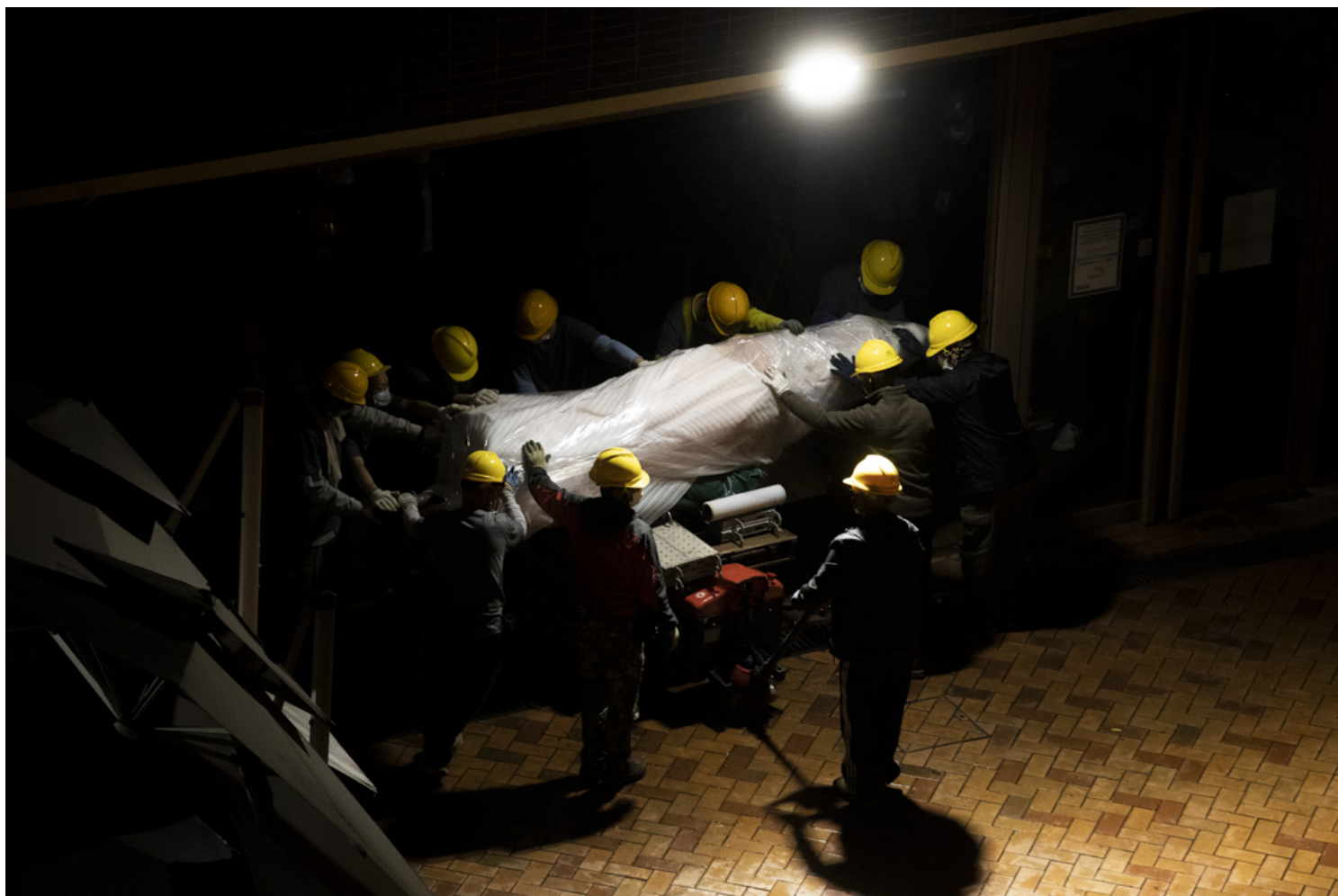
2021年12月23日凌晨，香港大學把悼念北京六四事件的雕塑「國殤之柱」圍封及拆走，工程人員將雕塑上半部份搬到貨車上。

以明少少道德責任，對個人能收谷勿公抹殺也。母打港人心係公 articulate 八白，也似切總百公放物也的再下目的。