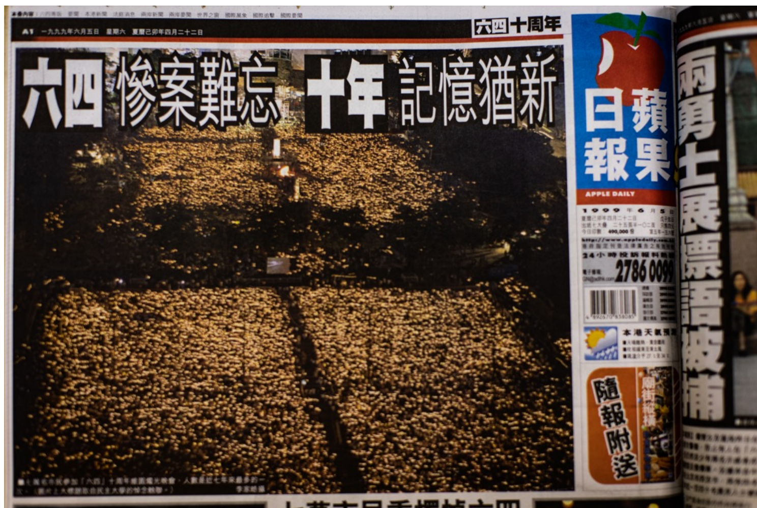
《蘋果日報》有關六四的報道。

我最近會有篇book chapter刊出，講疫情下的六四紀念。當然不是純粹講香港疫情，亦涉及政治環境變化，其中提到官方營造出來的模糊狀態。