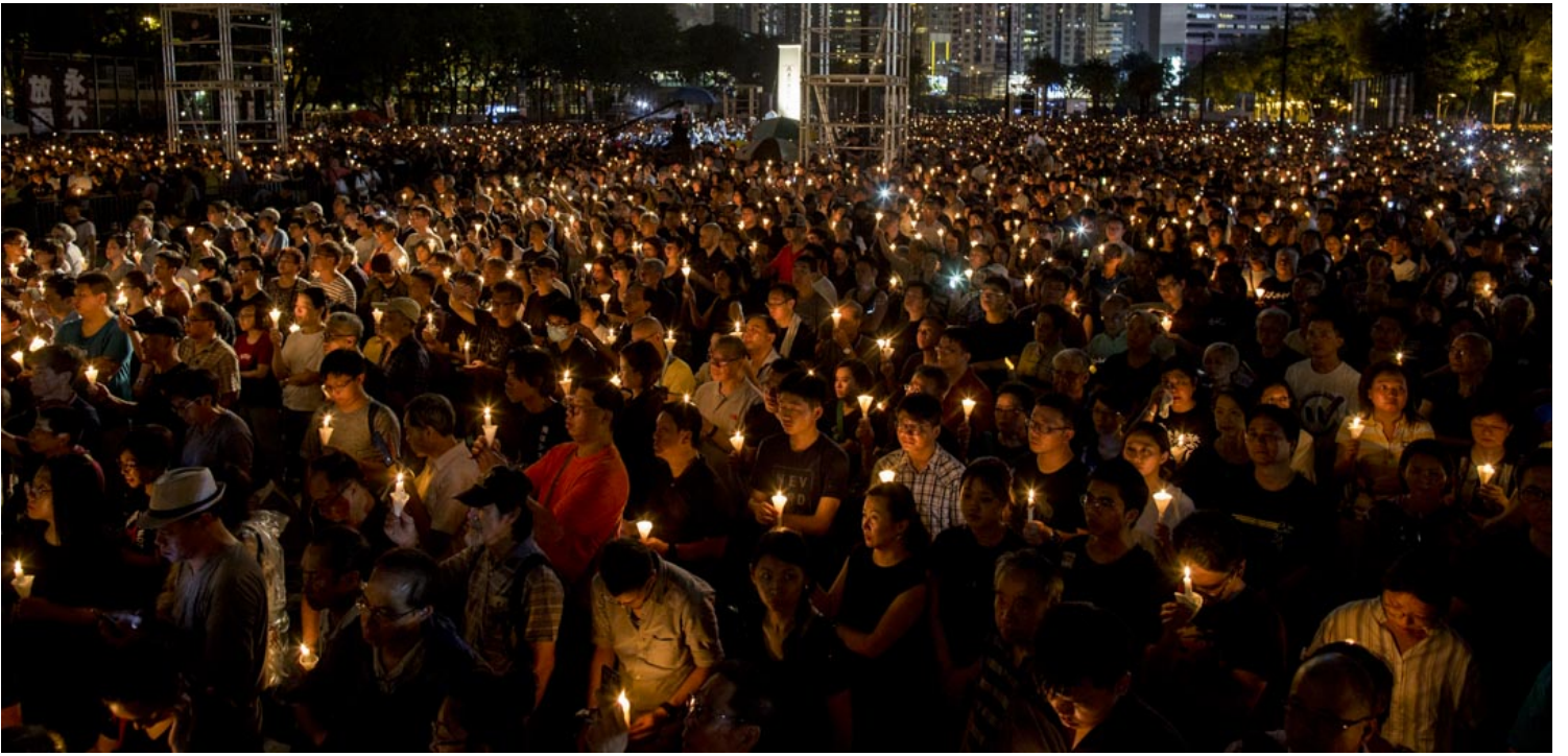
2019年6月4日，六四三十周年，維園燭光依然，主辦方公布集會人數高達18萬。

今年做問卷調查會難一些。就算我們不說什麼政治敏感，做一次問卷調查的成本是六位數字，真的涉及資金和排期，很難說無緣無故就去做。去年我就六四訪問了五個人，如果我每一年訪問幾個——也不用多，你也想像到未必可以訪問很多——你就當是攤長了來做四五年而已。那麼，你也可以儲起一些。