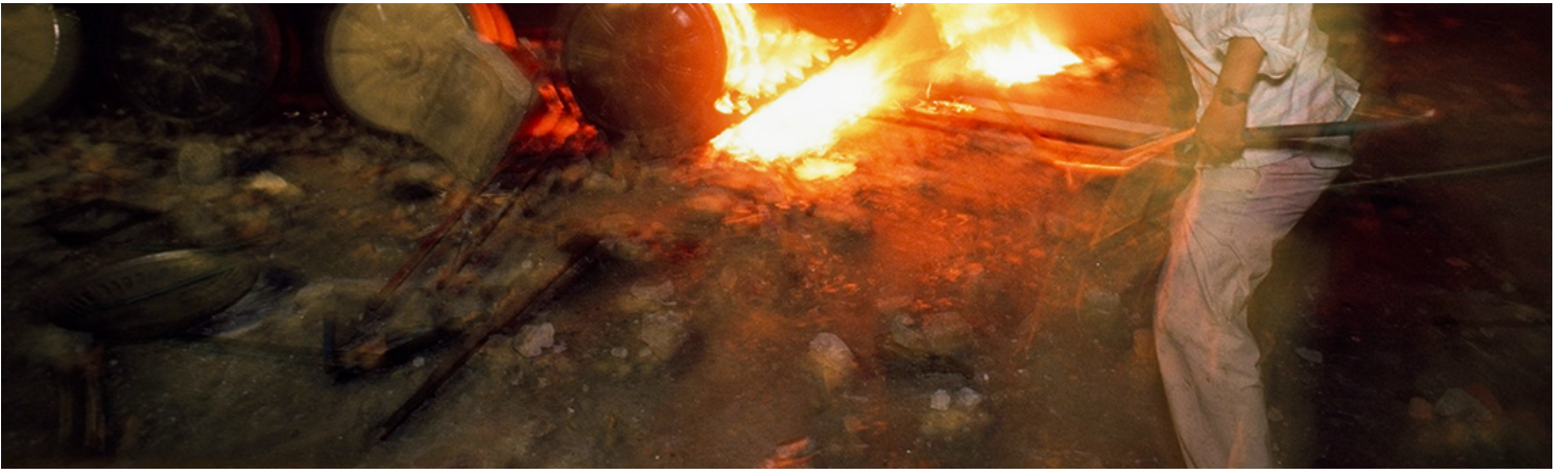
1989年6月4日，一名示威者與一輛燃燒的裝甲運兵車。

回到九七，當下的問題是香港之後還有沒有自由？如果你看過黃子華1999年的棟篤笑《拾下拾下》，開場白是：欸，這麼快回歸兩年了，司徒華還未被捕嗎？這是那年頭的玩笑，他捕捉的就是九七前後的 sentiments——司徒華會不會被捕？支聯會會不會被取締？很多事情是否還可以繼續做？籠統地說，自由還有嗎？