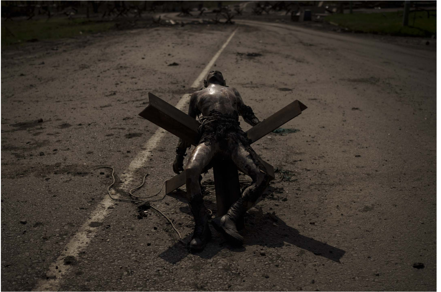
2022年5月1日，烏克蘭哈爾科夫市郊，烏克蘭軍隊奪回的一個村莊附近，一名身穿軍裝的身份不明男子的屍體躺在路障上。