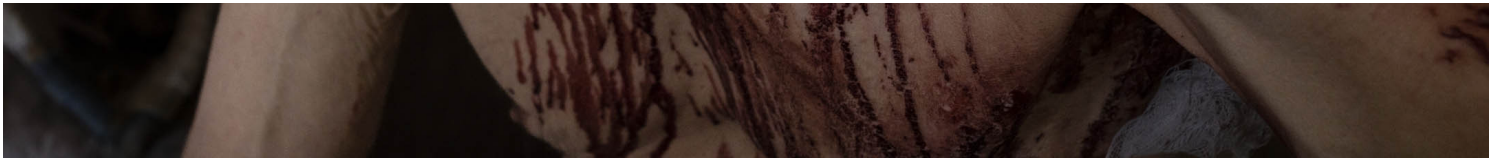
2022年7月7日，烏克蘭東部頓涅茨克地區克拉馬托爾斯克，受傷的 Volodymyr 坐在他受轟炸的公寓裡。