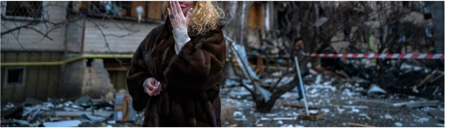
2022年2月25日，烏克蘭首都基輔，俄羅斯發射砲彈擊中民居，一名女子激動走避。