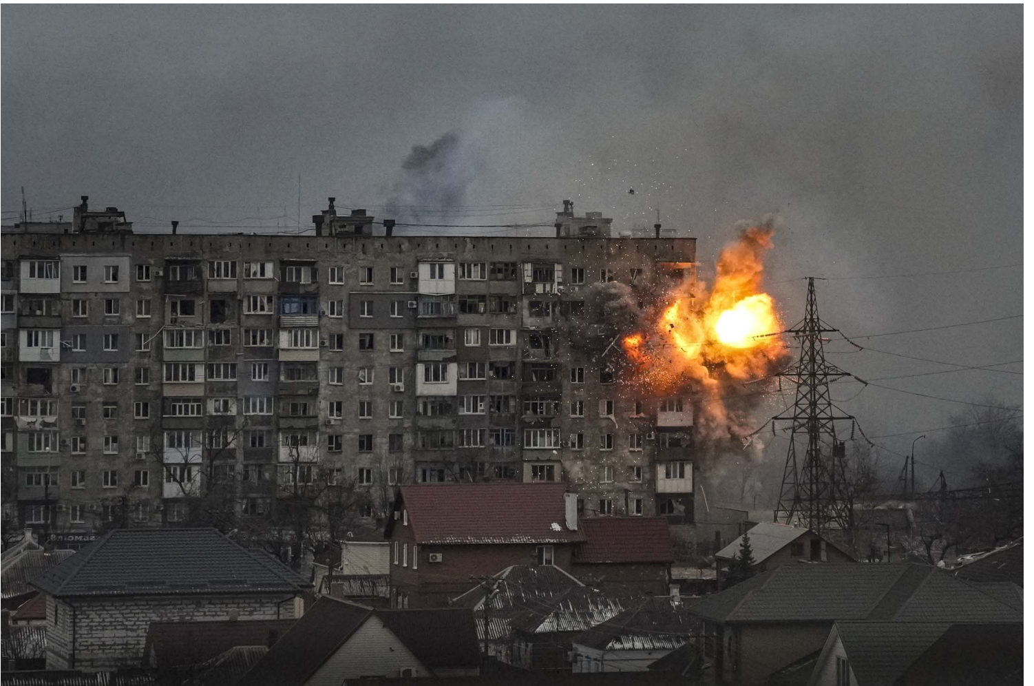
2022年3月11日，俄羅斯軍隊坦克在烏克蘭馬里烏波爾向 Mytropolytska 街 110 號的一棟公寓樓開火後發生爆炸。