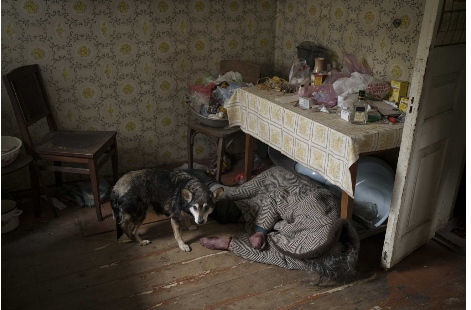
2022年4月5日，烏克蘭布查 (Bucha) 的一所房屋內，一隻狗站在一名老年婦女的屍體旁。