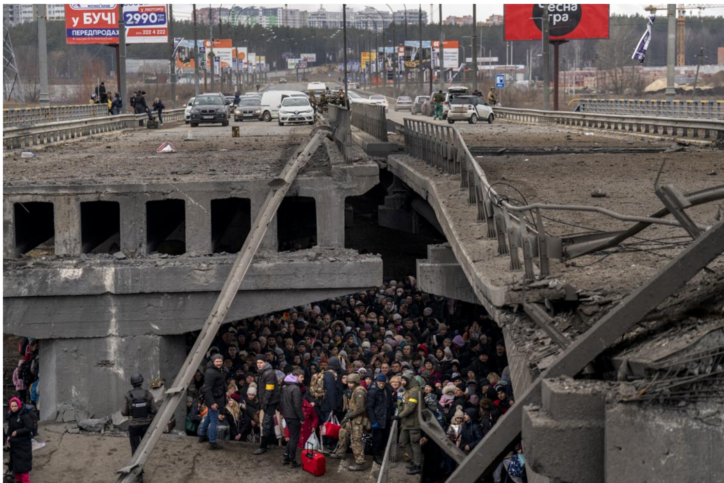
2022年3月5日，烏克蘭人聚集在一座被毀壞的橋下，試圖越過烏克蘭基輔郊區的伊爾平河 (Irpin' River)逃難。

美聯社攝影主任 J. David Ake 說：「今天，身處現場（採訪）比起任何時候都重要。否則，便不能捕捉到面前的世界，雖然這是十分骯髒、困難、危險的工作。」