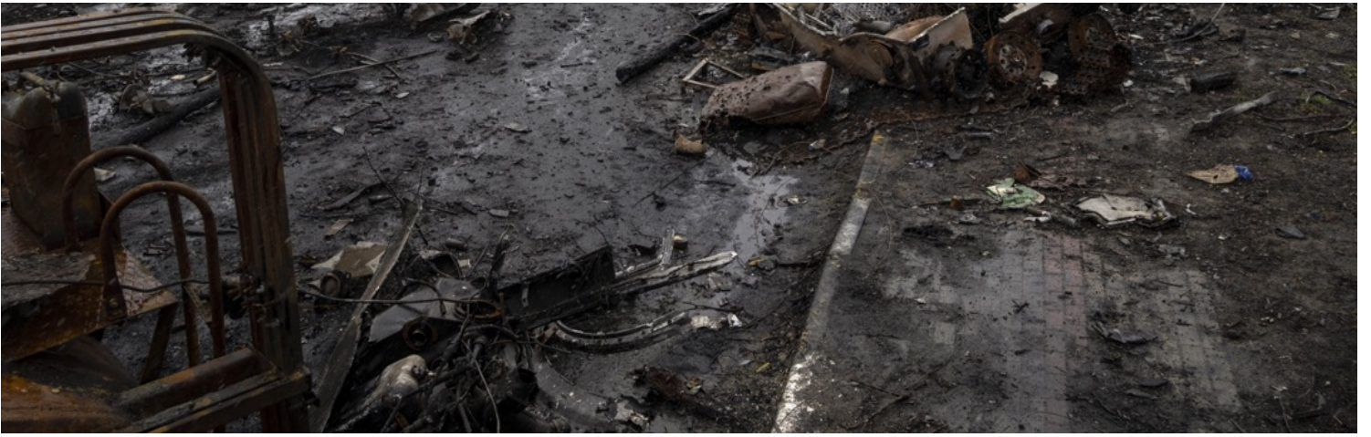
2022年4月2日，烏克蘭城鎮布查，一名女子在炸毀的坦克間走過。