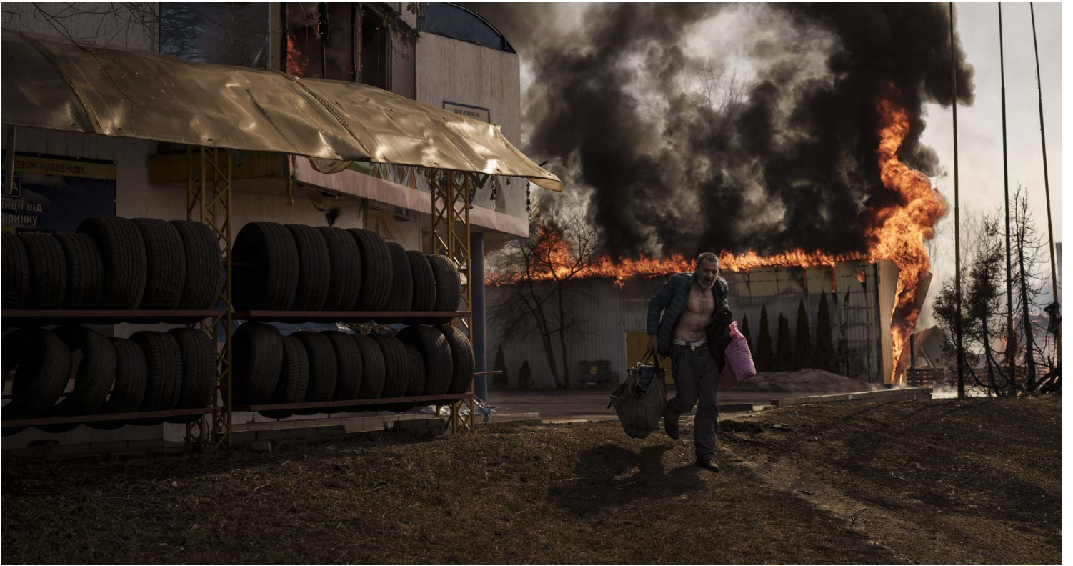
2022年3月25日，烏克蘭哈爾科夫，俄羅斯對當地發動襲擊後，一名男子帶著物品從燃燒的商店中奔跑出來。