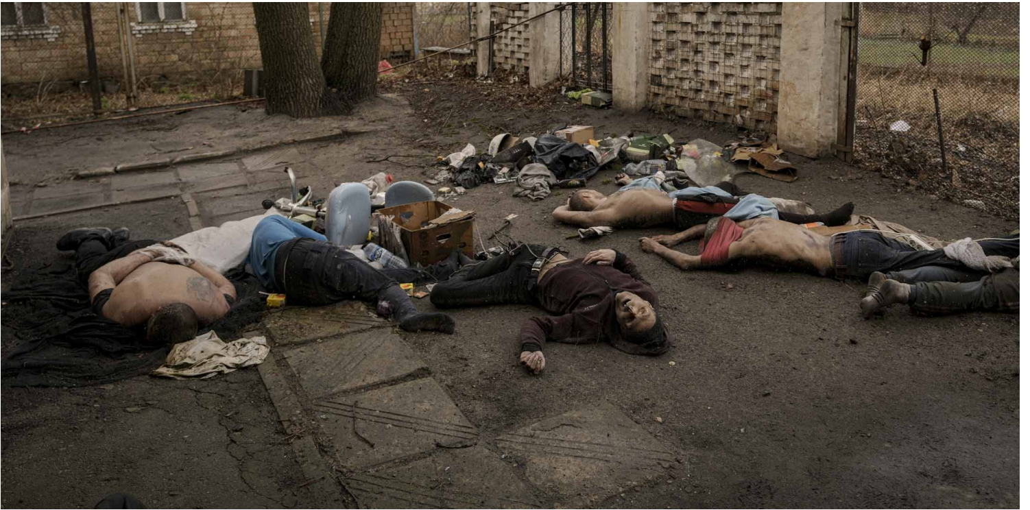
2022年4月3日，烏克蘭布查，一些男子的屍體躺在地上，其中一些雙手被綁在背後。