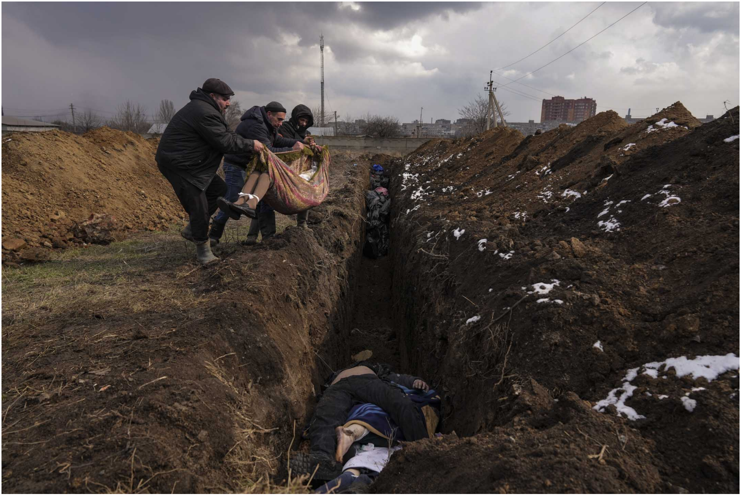
2022年3月9日，烏克蘭馬里烏波爾郊區，屍體被安置在的亂葬崗中。